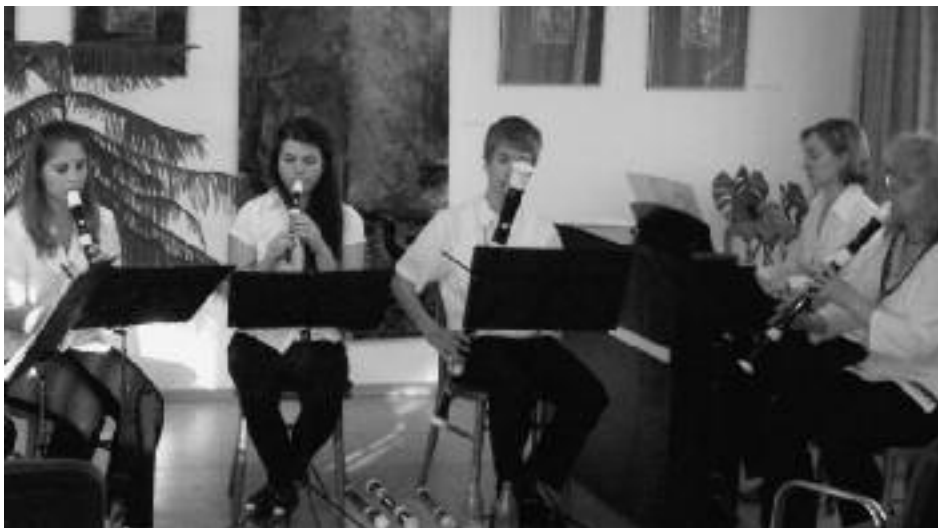
A furulyaegyüttes tagjai