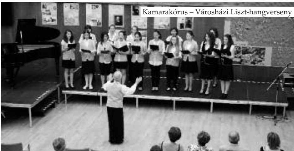
Kamarakórus – Városházi Liszt-hangverseny