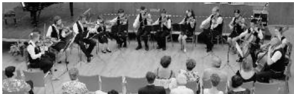
2011. május 27., Liszt és kora hangverseny, Városháza – Vonós kamarazenekar