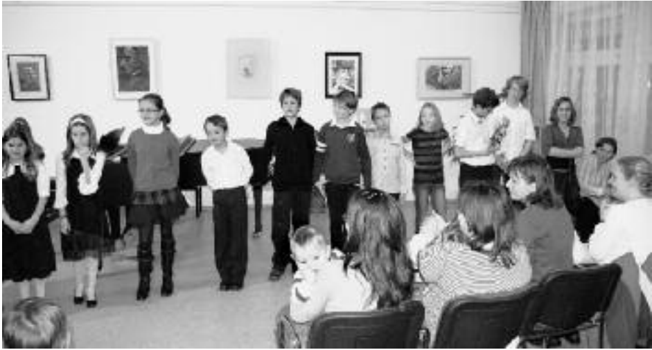
A Mikulás-ünnepség szereplői